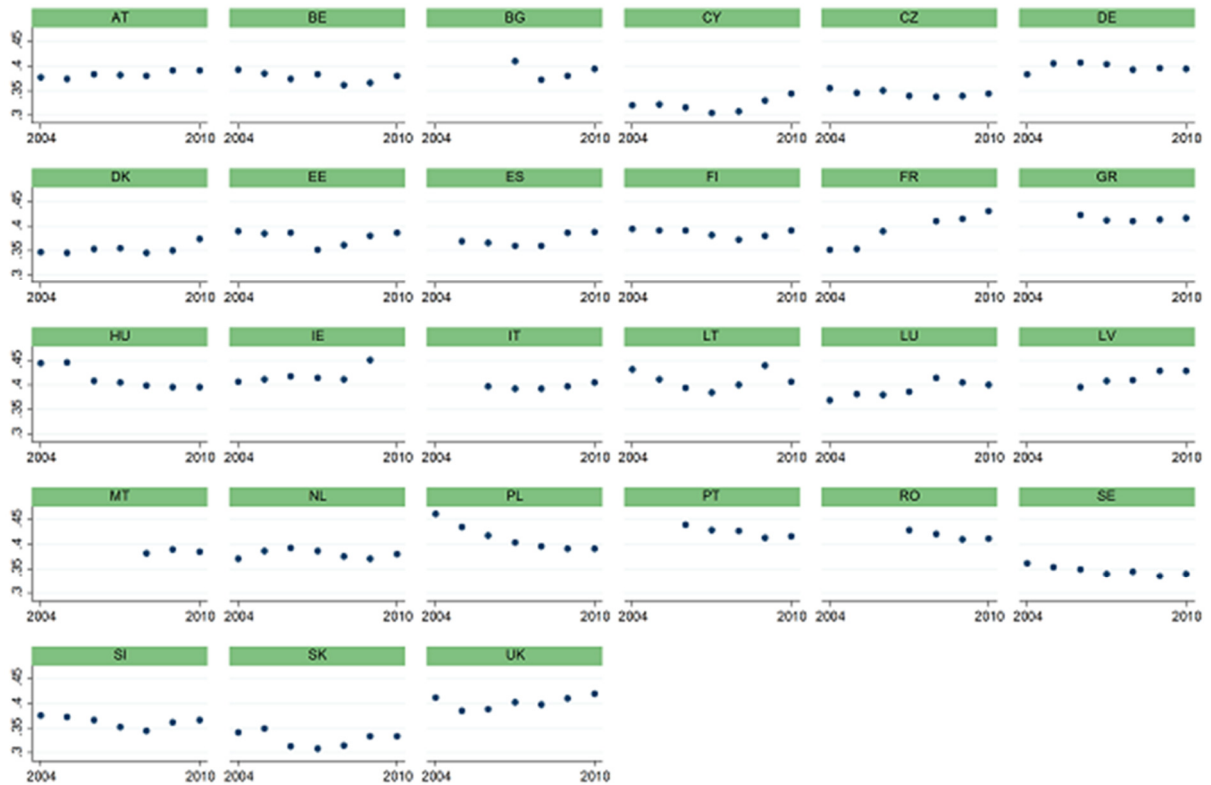
Figure 5: The Gini coefficient for household market income, 2004-2010

Source: European Commission, Eurostat, cross-sectional EU-SILC 2005-2011 European Commission, Social Situation Monitor